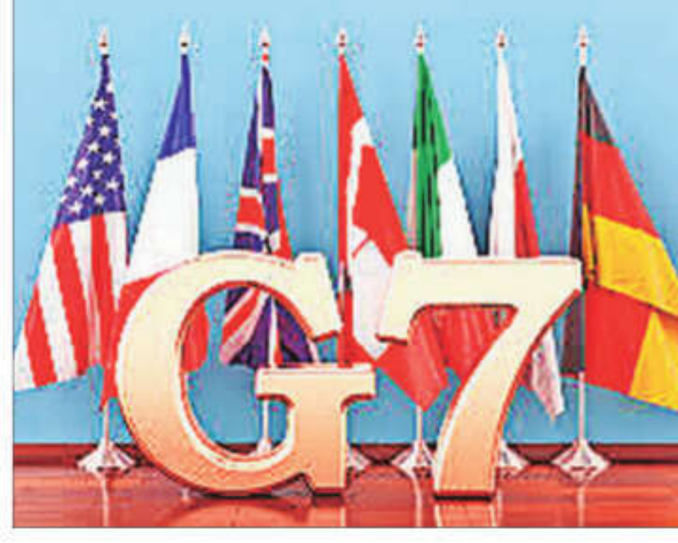
Finance officials from the Group of Seven rich democracies met in Stresa, on the shores of Lago Maggiore in northern Italy

Despite the progress made at the meeting in Stresa, on the shores of Lago Maggiore in northern Italy, a final decision on how the assets will be used will rest with the G7 national leaders, includ-